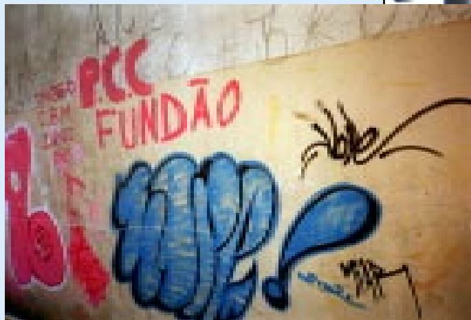
Pixação na escola E.E. José Lins do Rego

ciona aluno capacitado ou incapacitado. Quando acontece essa seleção e por comportamento não por QI”.