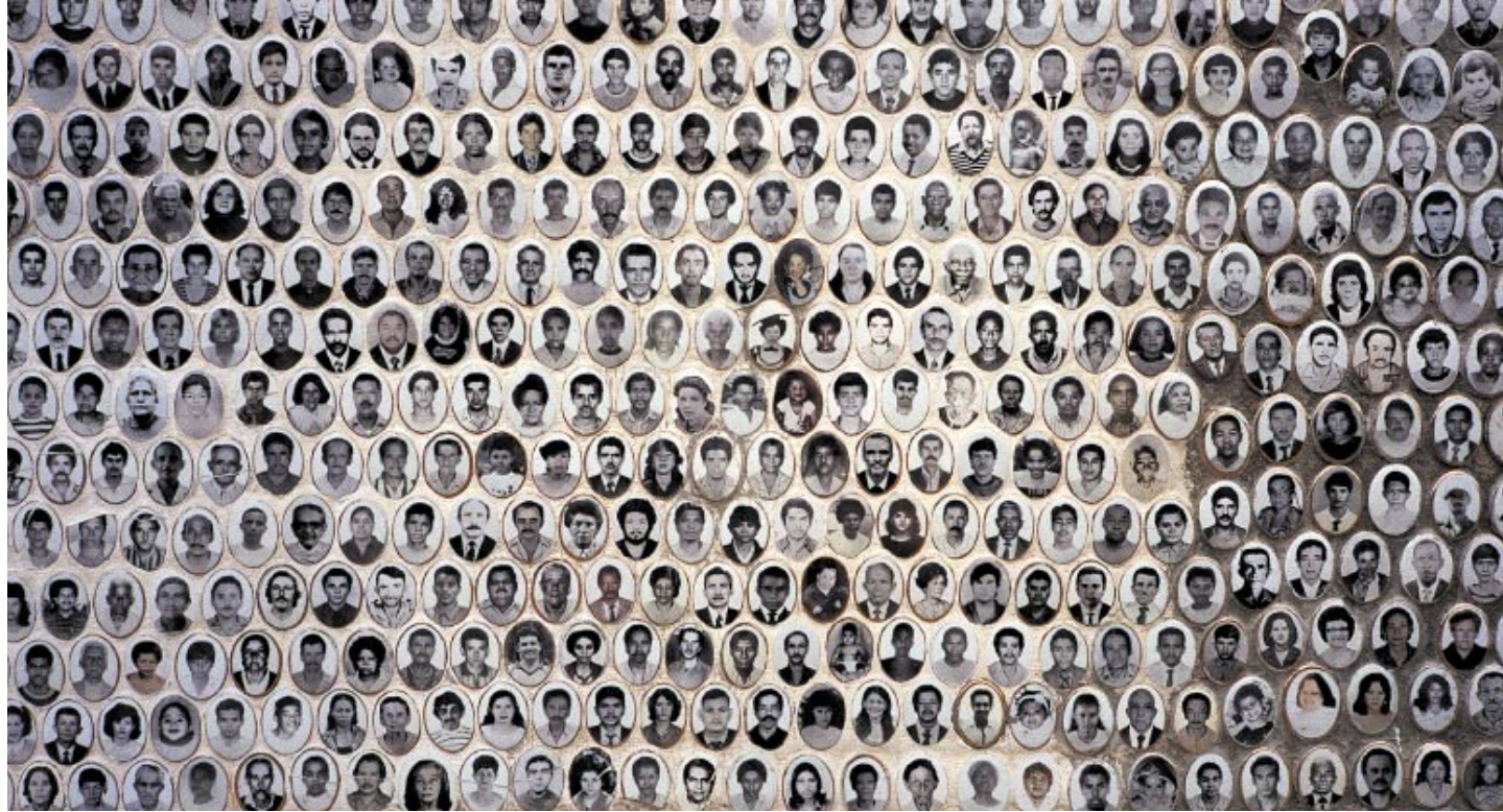
Muro do cemitério São Luiz, na periferia sul de SP

“É muito humilhante [vender balas dentro de ônibus]. Dependo da boa vontade dos motoristas e tem gente que não valoriza esse trabalho. Sou o único da minha família que vende, desde os 12 anos, balas dentro dos ônibus, mas conheço uma família em que todos trabalham no farol do Largo do Socorro.” Bruno, 16, vendedor de balas em ônibus que partem do terminal Santo Amaro, em São Paulo