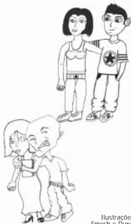
Ilustrações: Smesh e Dupac

M eus pais se conheceram quando, no tempo em que minha mãe ainda morava com os meus avós, por um convite do irmão dela, meu pai foi morar na casa em que ela morava. Naquele tempo, ele namorava uma prima, e minha mãe, um outro rapaz. Saíam juntos de vez em quando, mas sempre acompanhados por meu tio.